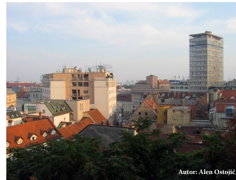
Autor: Alen Ostojić

No, krenimo redom. Zagrebparking je tijekom 2009. godine proveo javno nadmetanje za nabavu 500 digitalnih videokamera namijenjenih za projekt 'Prometno redarstvo'. Za nabavu navedene opreme podružnica Zagrebparking sklopila je 20. srpnja 2009. godine Ugovor o nabavi opreme-parking video nadzor broj N-38/09, s izvršiteljem King ICT d.o.o., Zagreb, s ugovorenim ukupnom cijenom od 15.985.375,82 kune bez pdv-a. Predmet nabave bila je dobava opreme za parking video nadzor, montaža do potpune funkcionalnosti opreme, puštanje u rad, dokumentiranje, sve uz primjenu klauzule 'ključ u ruke'. Nova Uprava Zagrebačkog holdinga na čelu s Ivom Čovićem (SDP) smjenjuje gospodina Kraljevića s mjesta direktora Zagrebparkinga i imenuje novog direktora koji sustav ne stavlja