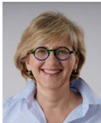
Piše: Saša Poljanac-Borić

Prijedlog „Zakona o obnovi zgrada oštećenih potresom na području Zagreba i okolice“ (nemojte meni pripisivati gramatičke pogreške točno sam prenijela službeni radni naslov Zakona) je dokument koji ima karakter naučničke vježbe provedene u „Radionici za izradu zakona i popravljane cipela“ a ne karakter dokumenta smišljenog u nadležnom ministarstvu državne uprave. Narodski rečeno, radi se o „navrat-na-nos“ a ne „ispeci-pa-reci“ radnom prijedlogu Zakona. Taj neprofesionalni uradak je zapravo, vrhunac birokratske inkompetencije i vjerojatno sama srž nezajžljive pohlepe u kojoj je pravopisno neartikuliran naslov (oštećen, područje) tek vrh sante leda bedastoća i nemorala koji su u nje ga utrpali, ne bi li se pokazalo da netko nešto suvislo radi, u nesuvislim uvjetima u kojima se – zna se zašto – nalazi grad Zagreb i njegova okolica.