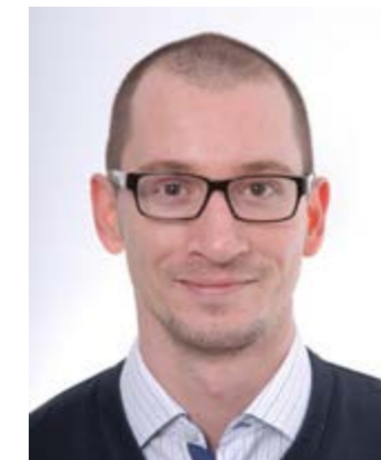
Piše: Sandro Salopek

Iako imaju brojne negativne posljedice, krize vrlo često pomažu da se određene relacije jasnije razmotre u ekstremnim uvjetima te tako mogu imati i pozitivan učinak na budući razvoj. Vjerujem da to vrijedi i u slučaju globalne krize uzrokovane globalnom pandemijom COVID-a, s kojom se u posljednje vrijeme suočavamo.