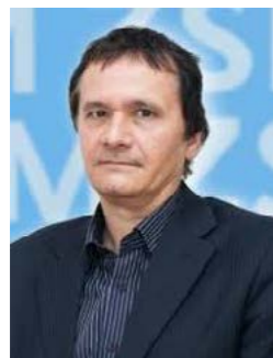
Piše: Boris Podobnik

U Hrvatskoj gotovo svi političari, sindikalci, ali i nemali broj profesora na državnim ekonomskim fakultetima ističu da je nužno sačuvati razinu plaća u javnom sektoru. Prema njima, zaposlenici javnog sektora su dokazano dobri, ako ne i bolji potrošači od zaposlenika u privatnom sektoru. Samo što sada novca nema jer smo ekonomija u karanteni pa se trebamo zadužiti. Međutim, kad država traži novac, kao garanciju vraćanja kre-